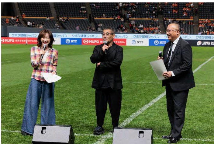
リーグワンの試合前の見どころ紹介