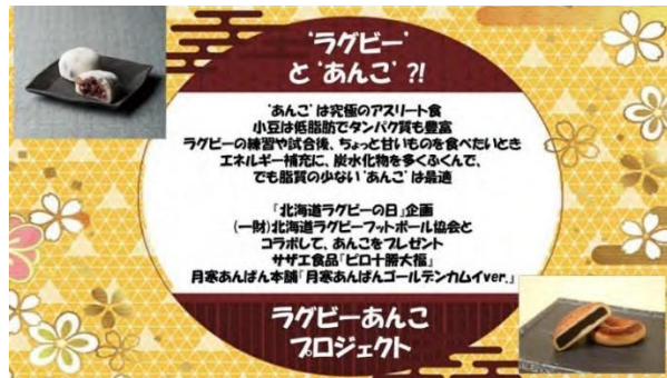
あんこプロジェクトのコンセプト