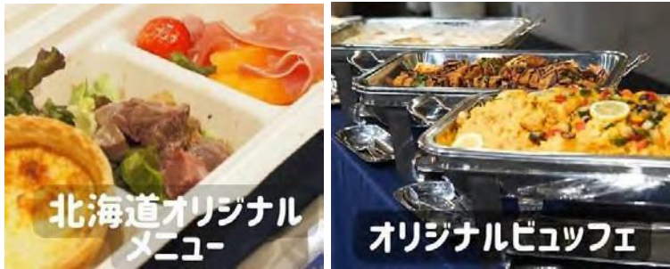
プレミアムシートでのフードサービス