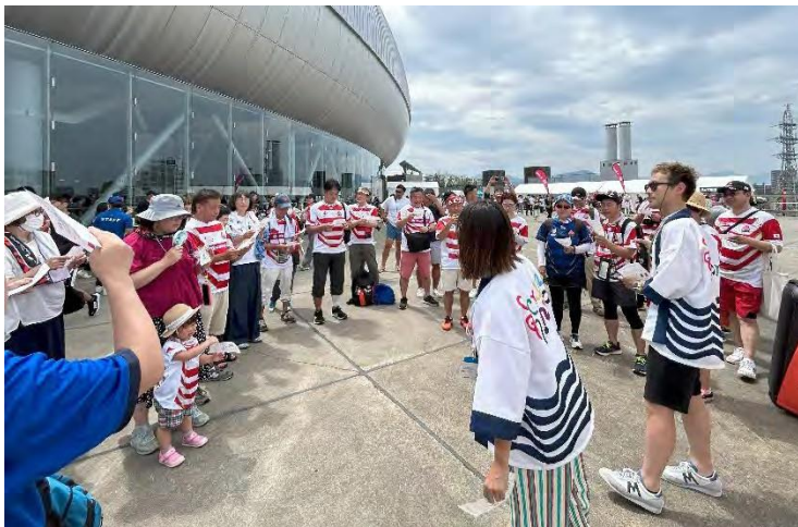
試合前のサポーターとの練習会