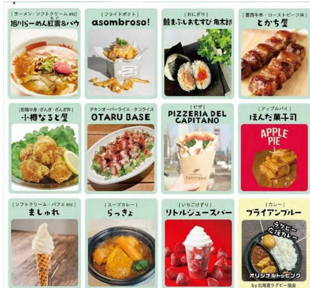
グルメガーデンのキッチンカー

2024年「北海道ラグビーの日」では、地域の魅力を発信し、ラグビーを通じた北海道の活性化を目指す「未来へのパスプロジェクト」を実施した。北海道の食とラグビーの融合により、来場者の皆様に地域の豊かさを体験いただける内容となった。