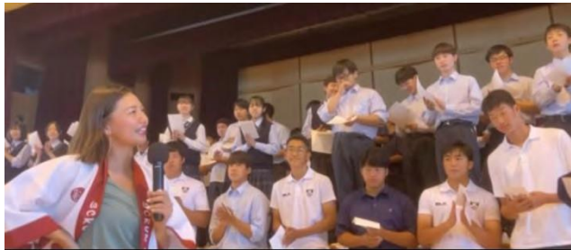
山の手高校での全校生徒練習会