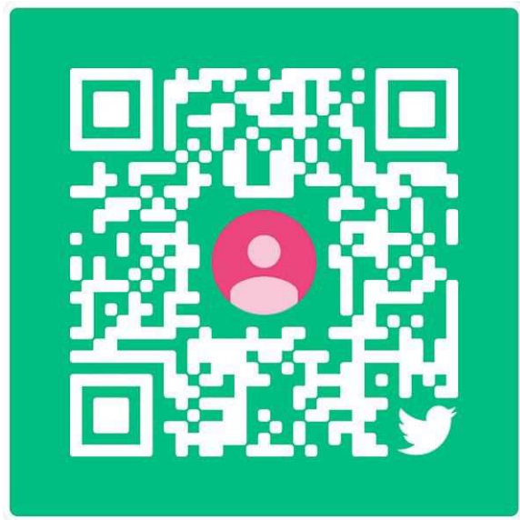
札幌支部普及育成 Twitter

感染症対策の観点から、当日会場内での試合結果は掲示いたしません。 随時、SNS（Twitter/Instagram）に投稿いたしますのでご確認ください。